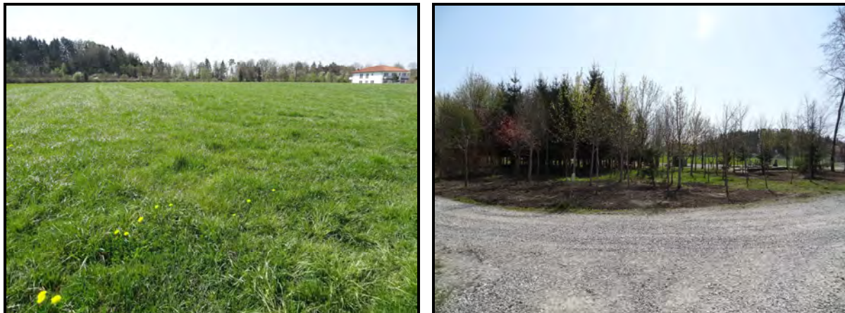
Abb. 2: Blick von Norden auf die Erweiterungsfläche (li) und die nördl. angrenzende Waldfläche

Das Planungsgebiet weist bedingt durch die Lage am Siedlungsrand, die intensive Nutzung und das Fehlen geeigneter Strukturen ein geringes Habitatpotenzial für nach § 44 BNatSchG geschützte Arten auf.