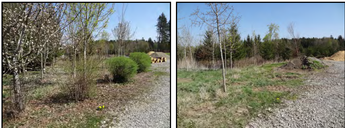
Abb. 4: Waldrandsituation mit Leitlinienfunktion für lokale Flugrouten von Fledermäusen

Der Gehölzbestand im Planungsgebiet und im unmittelbaren Umfeld des Vorhabens weist keine größeren Spalten oder Baumhöhlen auf, die als Habitat oder Quartier für Fledermäuse oder Vögel geeignet wären. Damit kann durch das Vorhaben eine Beeinträchtigung von Fortpflanzungsstätten von Fledermäusen ausgeschlossen werden. Nicht generell ausgeschlossen werden kann, dass jagende Fledermäuse tagsüber in den Rindenspalten größerer Bäume, die im Plangebiet fehlen aber z.B. im weiteren Umfeld des Planungsgebiets vorhanden sind, Ruhequartiere finden.