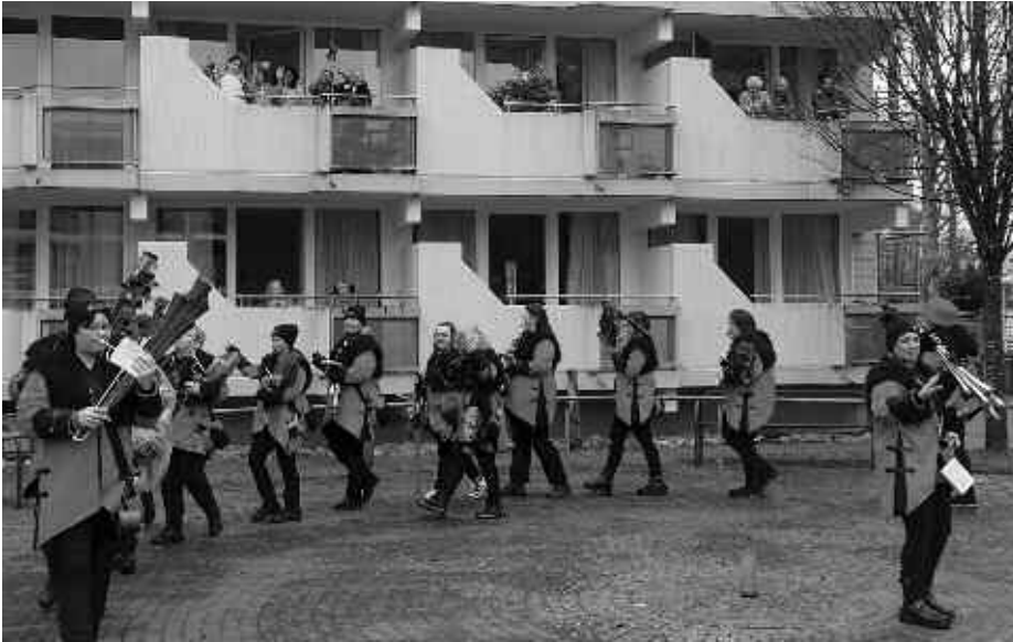
Die Schussentäler Schalmeyen versetzen die Bewohnerinnen und Bewohner des Wohnparks St. Vinzenz in begeisterte Fasnetsstimmung.