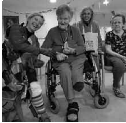
Die närrisch verkleidete Therapiehündin Maja verbreitet viel Freude im Wohnpark St. Vinzenz.