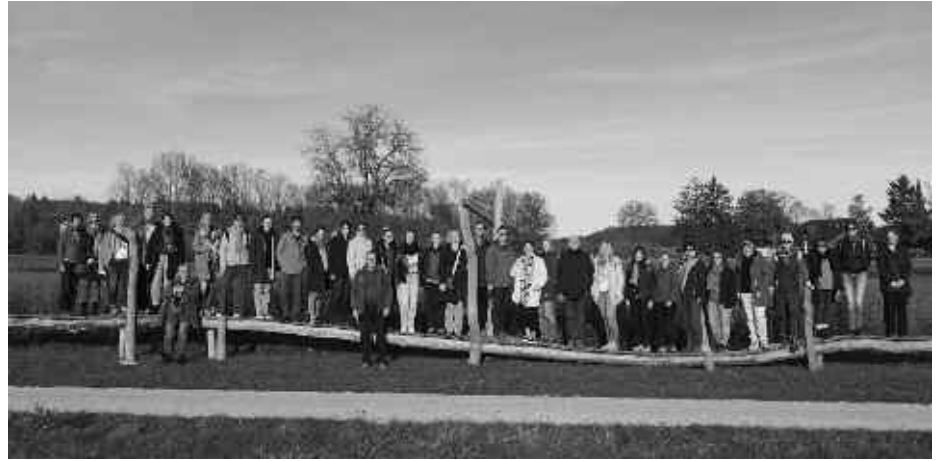
Vertreterinnen und Vertreter der 20 LEADER-Aktionsgruppen aus Baden-Württemberg zu Gast in der LEADER Region Mittlere Alb.

Der gemeinsame Social-Media-Auftritt bietet vielfältige Einblicke in die LEADER-Arbeit in Baden-Württemberg. Nach und nach werden alle beteiligten Regionen vorgestellt. Im