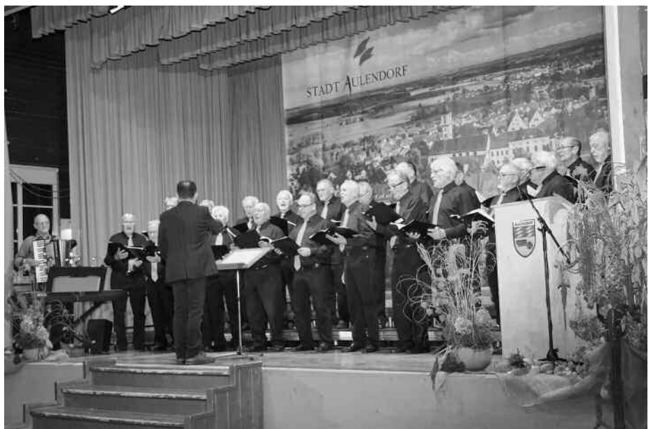
100 Jahre Sängerbund beim Jubiläumskonzert – jetzt steht die hundertste Generalversammlung an.