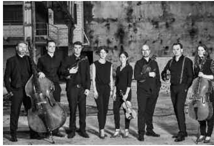
Das Ponticelli-Ensemble tritt am 6. April in Heggbach in der Festhalle auf und verspricht eine bunte Mischung von Barock- bis Musicalmusik.

Heggbach, Einlass ab 15 Uhr, Eintritt: 10 €, ermäßigt: 8 €. Kartenreservierungen per E-Mail: maximilian.klein@st-elisabeth-stiftung.de