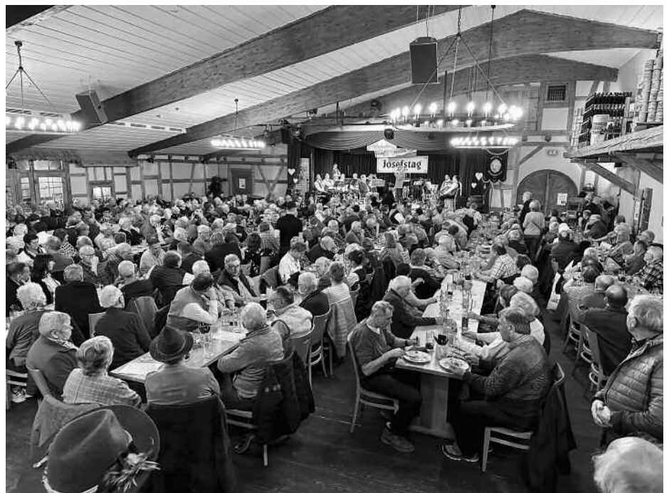
Foto vom Josefstag