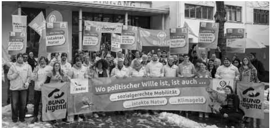
NaturschutzTage: Die Teilnehmer der Naturschutztage haben in einer kreativen Aktion den Abbau umweltschädlicher Subventionen zugunsten von Klima und Natur gefordert.

Die 48. Naturschutztage am Bodensee sind am 6.1.2025 nach vier Tagen mit rund 40 Veranstaltungen und mehr als 1.000 Besucher*innen zu Ende gegangen. Schwerpunkte in diesem Jahr waren Arten-, Klima- und Naturschutz sowie Forderungen der Naturschutzverbände für die anstehende Bundestagswahl. Hier setzten die Anwesenden gemeinsam ein starkes Zeichen für mehr Investitionen der Bundesregierung für Klima, umwelt- und sozialgerechte Mobilität sowie intakte Natur. Die BUND Landesverband