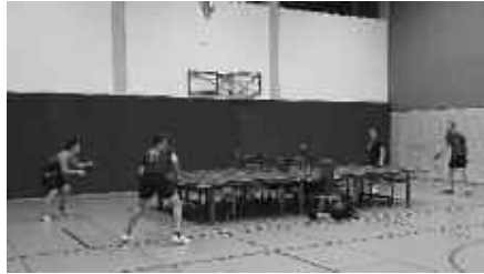
Erstes Training in der neurenovierten Schulsporthalle

Kurzer Rückblick: Im Juli 2023 war es soweit, die Schulsporthalle sollte renoviert werden und die Tischtennisabteilung stand zunächst vor einer unruhigen Zukunft, lange war nicht klar, wo und wie es weitergehen sollte, da sich die Suche nach einer Ausweichstätte für die große Abteilung als sehr schwierig gestaltete. Man ließ sich jedoch nicht entmutigen und nach vielen Gesprächen und Bemühungen fand man dann in der Grundschulsporthalle eine beengte, aber durchaus zufriedenstellende Bleibe. Zunächst nur für den Trainingsbetrieb und die Heimspiele der Damen und Herren konnte man auch ab September 2024 die Jugendspiele dort abhalten. Zuvor konnte man diese beim benachbarten Verein TTC Bad Schussenried austragen, die Senioren kamen teilweise beim ASV Otterswang unter, dafür an beide Vereine ein großes Dankeschön für die selbstlose Unterstützung. Wei-