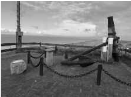
Aussichtsplattform auf der Ostfriesischen Insel Nordaney, mit einem historischen Stockanker. Diese wurden hauptsächlich bis ins spätere 19. Jhd. auf Großseglern benutzt.

Die verzweifelten Bemühungen der Matrosen sich und ihr Schiff zu retten werden am Ende des Liedes mit einem fulminanten Crescendo wiedergegeben. Spätestens jetzt erfasste viele Zuhörer und alle tatsächlich zur See gefahrenen Sänger des Chores ein Gänsehautgefühl oder ein ehrfürchtiger Schauer. Auch das neue Lied des Marinechors, die ursprünglich holländische Ballade „HEILIG-ABEND AUF DEM MEER“ erzählt die Weihnachtsgeschichte aus der Sicht der Seefahrer, geprägt von Heimweh und Melancholie aber auch von Euphorie und Hoffnung. Mit diesen Emotionen beendete der Marinechor Aulendorf sein Weihnachtskonzert in Bad Saulgau.