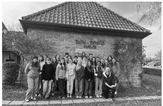
Schülermentoren am Studienkolleg St. Johann