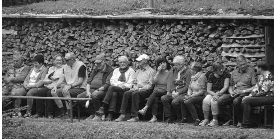
In Reih und Glied – der Aulendorfer Sängerbund am 1. Mai.

Für die Vergabe des Awards gelten strenge Regeln: Um überhaupt in die Auswahl für die begehrte Auszeichnung zu kommen, muss ein Hotel über einen Zeitraum von zwölf Monaten (1. Dezember 2022 bis 30. November 2023) mindestens 50 Bewertungen erhalten haben. Die Unterkünfte müssen zudem von