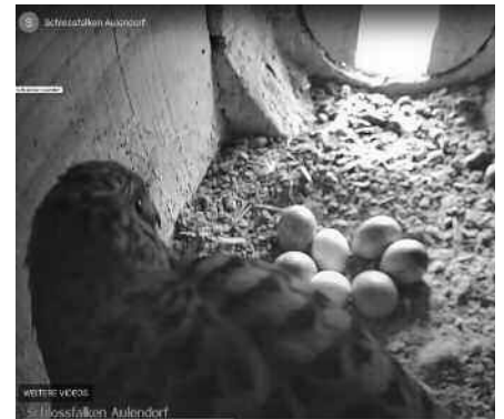
Die beiden Schlossfalken wechseln sich gerade ab, bei der Brutpflege der sieben Falkeneier.

Seit dem 1. Mai wird der Live-Stream aus dem Falkenhorst im Schloss ins Internet geschaltet. Bereits jetzt liegen 7 Eier im Nest. Es werden sogar die Töne der Falken mitübertragen.