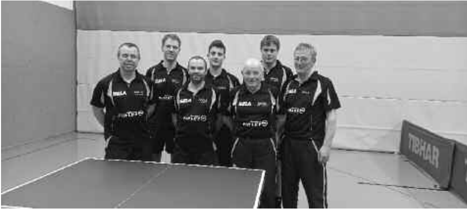
Foto: Mannschaftsfoto der Herren 3