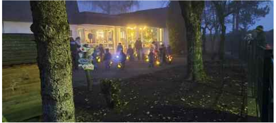
Kindergarten St. Georg

Eine große Hafentrundfahrt durch den beeindruckenden Hamburger Hafen, ein etwas anderer Stadtrundgang, bei dem nicht die klassischen Wahrzeichen der Stadt, sondern die verborgenen Perlen im Vordergrund standen, und eine Fleetfahrt über die herbstliche Alster bildeten das Rahmenprogramm für die Woche. Ein Besuch im Miniatur-Wunderland, der größten Modelleisenbahn der Welt, war das Highlight der Fahrt. Die Gruppe war beeindruckt, mit welcher Ruhe und Verliebtheit zum Detail hier fleißige Modellbauer eine gigantische Miniaturausgabe der unterschiedlichsten Länder und Gegenden der Welt konstruiert haben. Die Schülerinnen und Schüler nutzten ihre Freizeit während der Tage in der Landeshauptstadt, aber auch zum individuellen Erkunden. Stadionführung, Musicalbesuch,