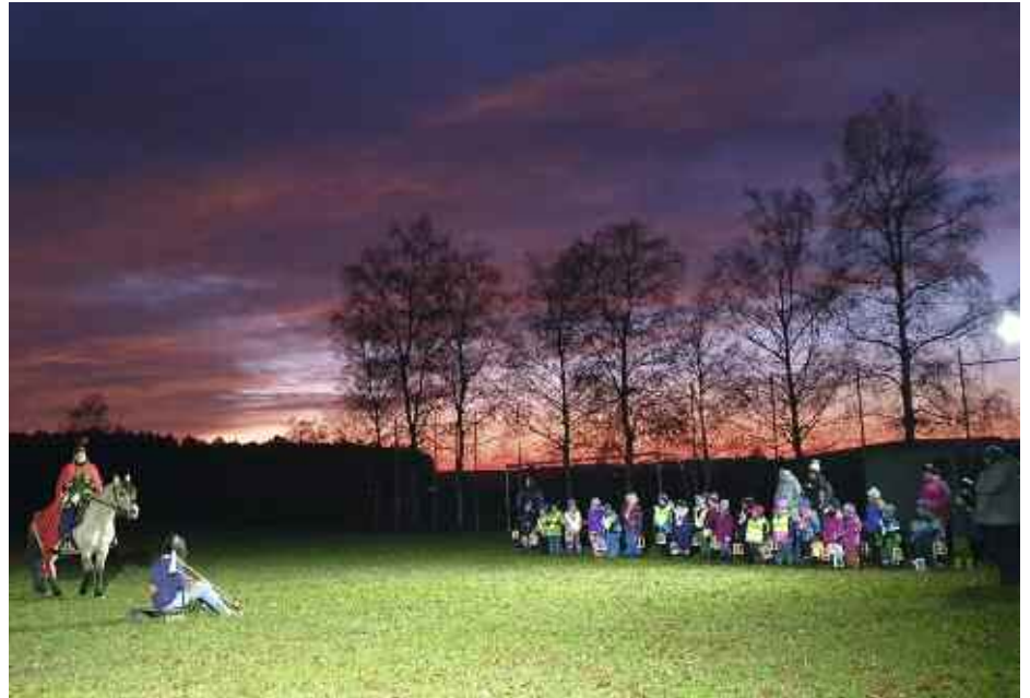
Bei herrlicher Kulisse konnten die Kinder des Kindergarten St. Josef und des Waldkindergartens dem Martinsspiel auf dem Sportplatz folgen.