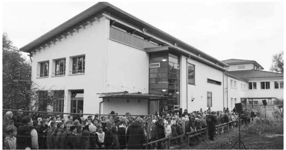
Die Grundschüler singen „Wer will fleißige Handwerker sehen?“