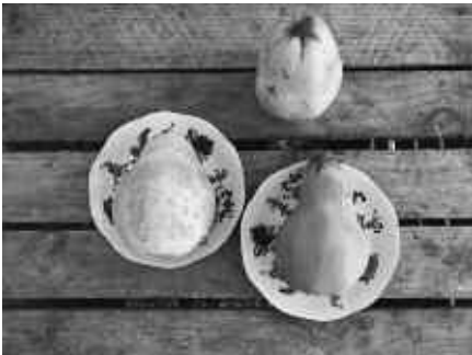
Aus Quitten kann lecker Marmelade hergestellt werden.

Weitere Ernten im Herbst: Brokkoli, Karotte, Kürbis, Apfel, Bohne.