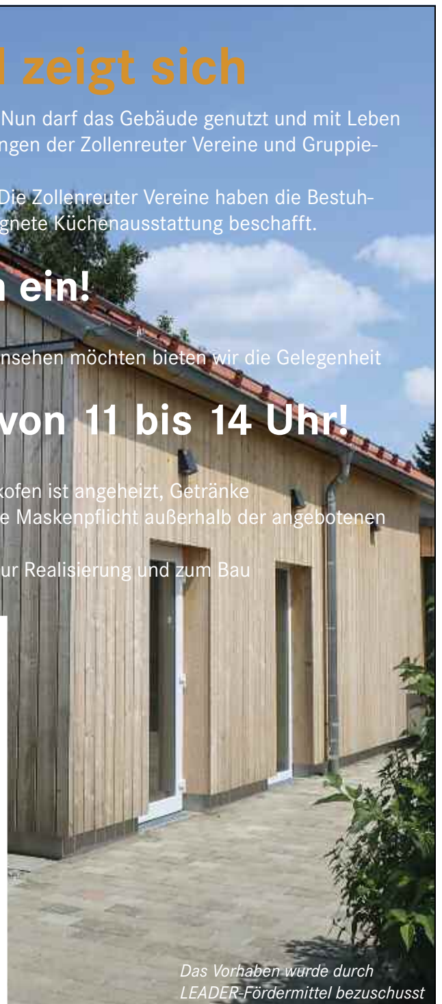
Das Vorhaben wurde durch LEADER-Fördermittel bezuschusst