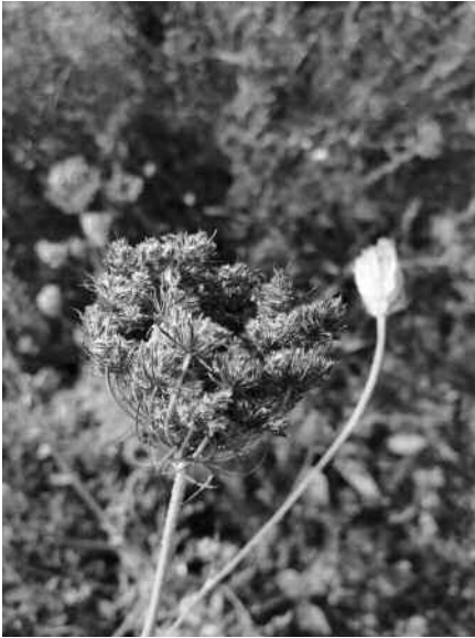
Hier verpuppt sich der Schwalbenschwanz – Verblühte wilde Möhre in Ravensburger Blühstreifen

Für weitere Informationen kontaktieren Sie uns gerne.