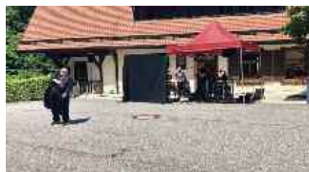
Rechts: das Stück „Charlie Chaplin“ vom Theater „die Tonne“ aus Reutlingen

Neben den gemeinsamen Programmpunkten aus Stuttgart und Bad Waldsee wurden