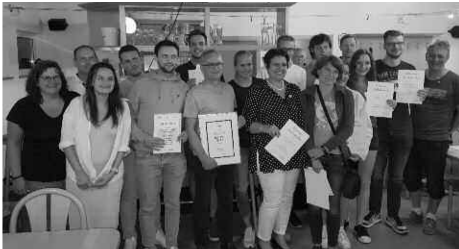
Alle Geehrten der Tischtennisabteilung

Bei der diesjährigen Jahreshauptversamm-