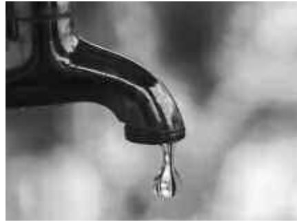
Was spart Wasser?

Die Ferien stehen vor Tür oder sind bereits in vollem Gange und die Planungen für Urlaub, Ausflüge und Aktivitäten in der Natur laufen auf Hochtouren. Doch wo darf ich eigentlich Baden, wie spare ich Wasser im Hochsommer, welche Sonnencreme ist die richtige für die Haut und die Umwelt oder wie mache ich meinen Garten fit für den Klimawandel? Im Rahmen einer Interviewreihe „Gut Leben im Sommer“ gibt der BUND Antworten auf diese und weitere Fragen. Weitere Infos: www.bund.net/bund-tipps/