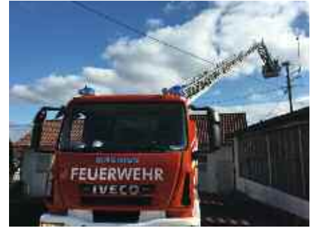
Die Aulendorfer Feuerwehr gemeinsam mit dem BUND arbeiten und überprüfen das Storchennest.